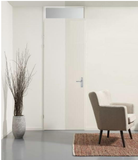
Standaard stalen binnendeurkozijn met bovenlicht opdeur